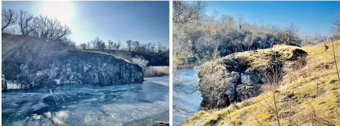
Рис. 1. Краєвиди Тясминського каньйону

laevigata (Poir.) DC., а також різними видами папоротей – Asplenium trichomanes L., Asplenium septentrionale (L.) Hoffm., Polypodium vulgare L., Cystopteris fragilis (L.) Bernh. Тут зростають також степові мохи, такі як Pterygoneurum ovatum (Hedw.) Dixon, Astomum crispum (Hedw.) Hampe, Pottia lanceolata (Hedw.) Müll. Hal. та різні наскельні мохи.