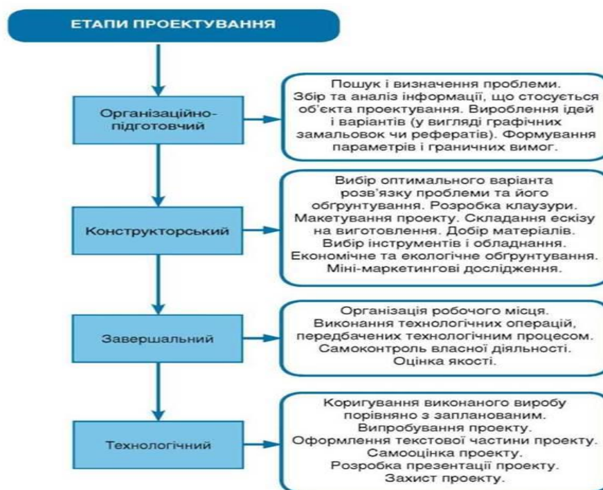
Рис. 2. Етапи навчального проектування.

Технологічна діяльність забезпечує послідовне включення учнів в усі етапи цілісного процесу проектування й виготовлення виробів: вибір об'єкту технологічної діяльності; обґрунтування цього вибору; художнє конструювання; технічне конструювання; підбір конструкційних матеріалів; вибір технологічних процесів, інструментів, обладнання; виготовлення виробів; аналіз і оцінка процесу і результату праці; нескладні маркетингові дослідження (рис. 2).