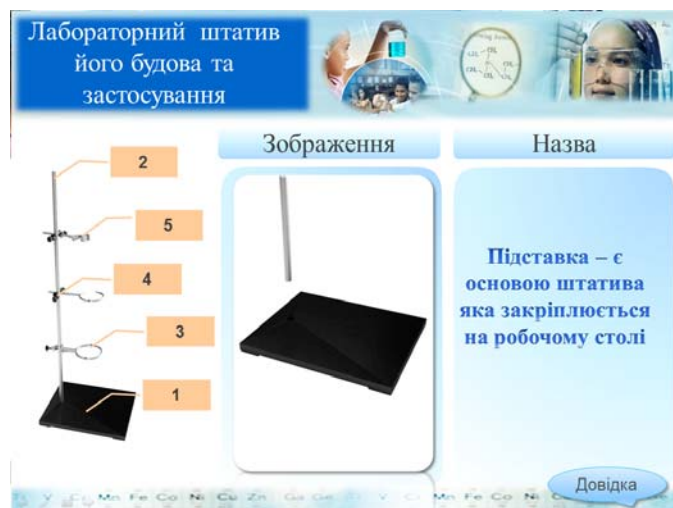
Рис. 1. Фрагмент інтерактивної презентації з використанням тригерів

Для створення мультимедійних дидактичних матеріалів потрібно керуватись такими критеріями відбору інформації [5]: