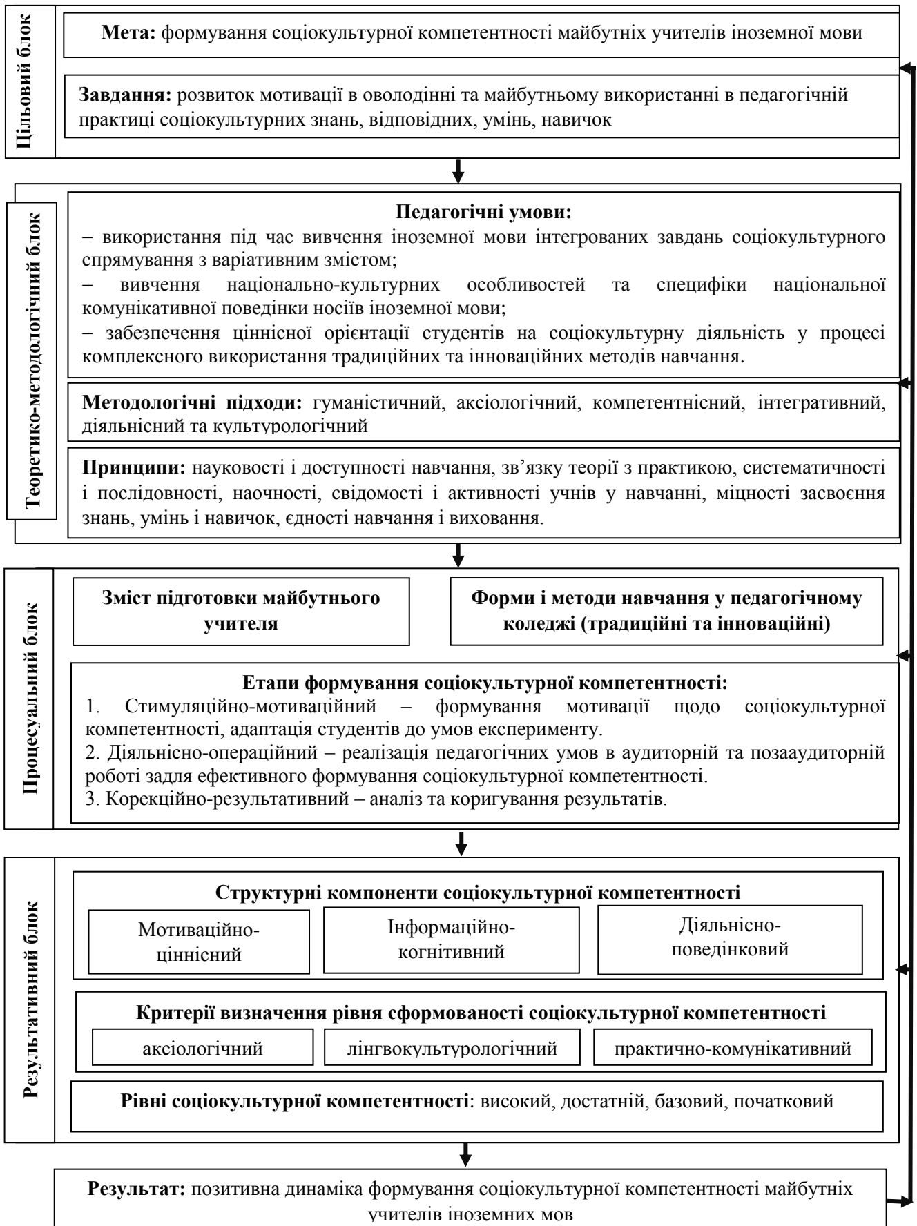
Рис. 1. Структурно-функціональна модель формування соціокультурної компетентності майбутніх учителів іноземної мови