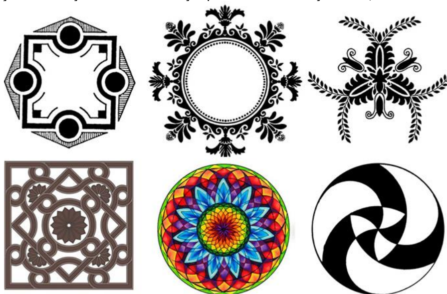
Рис. 3. Приклади центричних орнаментів.

2. Центричний орнамент, в основу якого покладено принцип центрально-осьової симетрії, коли рапорт обертається навколо центральної осі (рис. 3). Мотиви в такому орнаменті розміщуються від центральної точки по променях, заповнюючи всю поверхню, обмежену колом, і під час обертання повністю збігаються. Найхарактерніший приклад центричного орнаменту – розетка, що відображає мотив розквітлої квітки. Це дуже древній вид орнаментальної побудови, який відомий ще з часів Давнього Єгипту і який набув найбільшої популярності в готичному мистецтві.