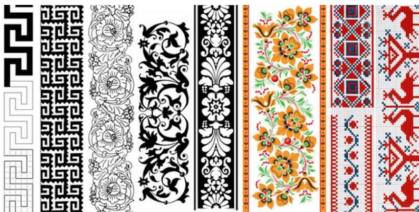
Рис. 2. Приклади стрічкових орнаментів.

Під час побудови в основу композиції закладаються різні види симетрії: дзеркальна симетрія, по вертикалі, горизонталі або діагоналі. І також різні принципи ритмічної побудови елементів – повторення, чергування, у тому числі за кольором і тоном.