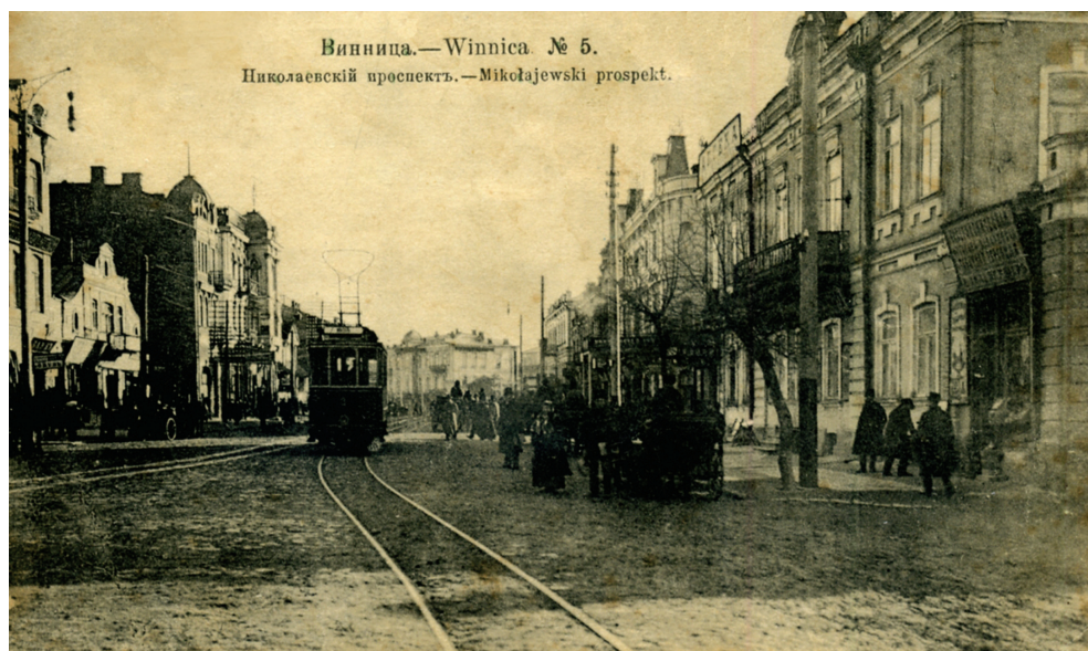
570. Миколаївський проспект (нині вул. Соборна). Поштівка, близько 1914 р.

З перших днів діяльності П. Гусаков прагнув стабілізувати ситуацію в регіоні шляхом посилення контролю над життям громадян, відновлення права приватної власності, обеззброєння населення. У своїх діях Гусаков опирався на новий правоохоронний орган. 18 травня 1918 р. було ухвалено закон про скасування міліції та створення Державної варти, підпорядкованої міністерст-