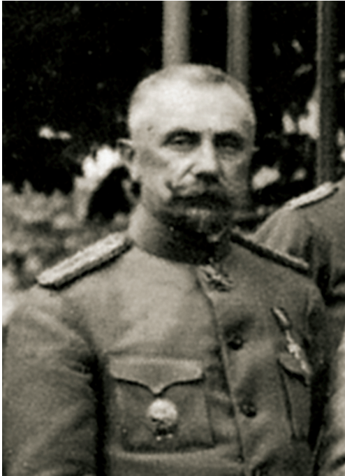
572. Генеральний хорунжий Петро Єрошевич, 1918 р.

Вранці 19 листопада 1918 р. міський голова Вінниці А. Фанстіль отримав від представників Вінницької філії УНС повідомлення про те, що вона від імені Директорії УНР перебирає у свої руки всю владу на Поділлі до призначення відповідної адміністрації. Вінницька філія УНС повідомляла, що адміністративну владу повинні тимчасово взяти колишні комісари Центральної Ради, а там, де їх немає, – голови земських управ, або їхні заступники. Проголошувалося відновлення розформованих гетьманським урядом самоврядувань, наголошувалося на неприпустимості єврейських погромів, грабунків мирного населення, військових складів [35, с. 138].