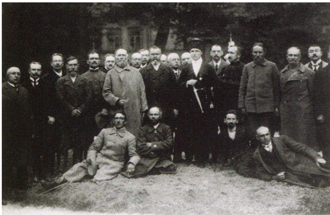
569. Делегати від Подільської губернії на Всеукраїнському з'їзді хліборобів разом із гетьманом Павлом Скоропадським, 29 квітня 1918 р.

Австро-угорські підрозділи були певним стабілізаційним елементом, залучалися до правоохоронних функцій. У травні 1918 р. територію Вінниці було поділено на 11 округів. Поряд з українськими правоохоронцями в кожен округ направлено 40 австро-угорських солдат [7, с. 74]. 20 травня 1918 р. Вінницька міська міліція і австрійські підрозділи здійснили облаву на Замості, в результаті якої було затримано 60 осіб, в яких вилучили значну кількість зброї і великі суми грошей [15, арк. 214–215; 7, с. 74]. Разом з тим, порядок австро-угорські підрозділи підтримували доволі жорсткими методами. Так, з 22 травня 1918 р.