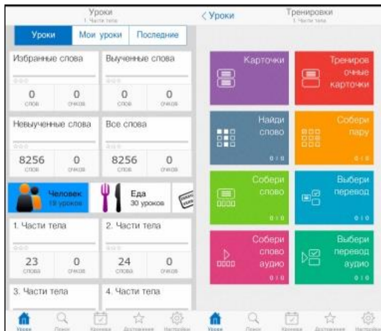
Види тренувальних вправ для вивчення англійської мови в соціальному додатку «Англійська з Words»

«Англійська з Words» – додаток дозволяє тренувати знання слів з певної тематики, вивчати правильну вимову та написання. Спочатку користувач ознайомлюється зі словниковим набором з певної тематики, слухає вимову та звертає увагу на написання. Далі починається тренування з перекладу засвоєних слів. Дана вправа націлена на розвиток рівня і мотивації до самоконтролю вивченого матеріалу. Наступним етапом є поліпшення запам'ятовування написання слова (spelling), так як перед користувачем стоїть завдання знайти слово в наборі літер. Переклад слів закріплюється четвертою вправою, де користувачу пропонується підібрати пари у форматі “англійська-українська” вивчених слів. Сприйняття слова на слух автоматизується вправою на відтворення слова в письмовій формі після прослуховування його в усній. Подібна навичка закріплюється також прийомами аудіювання навчального матеріалу.