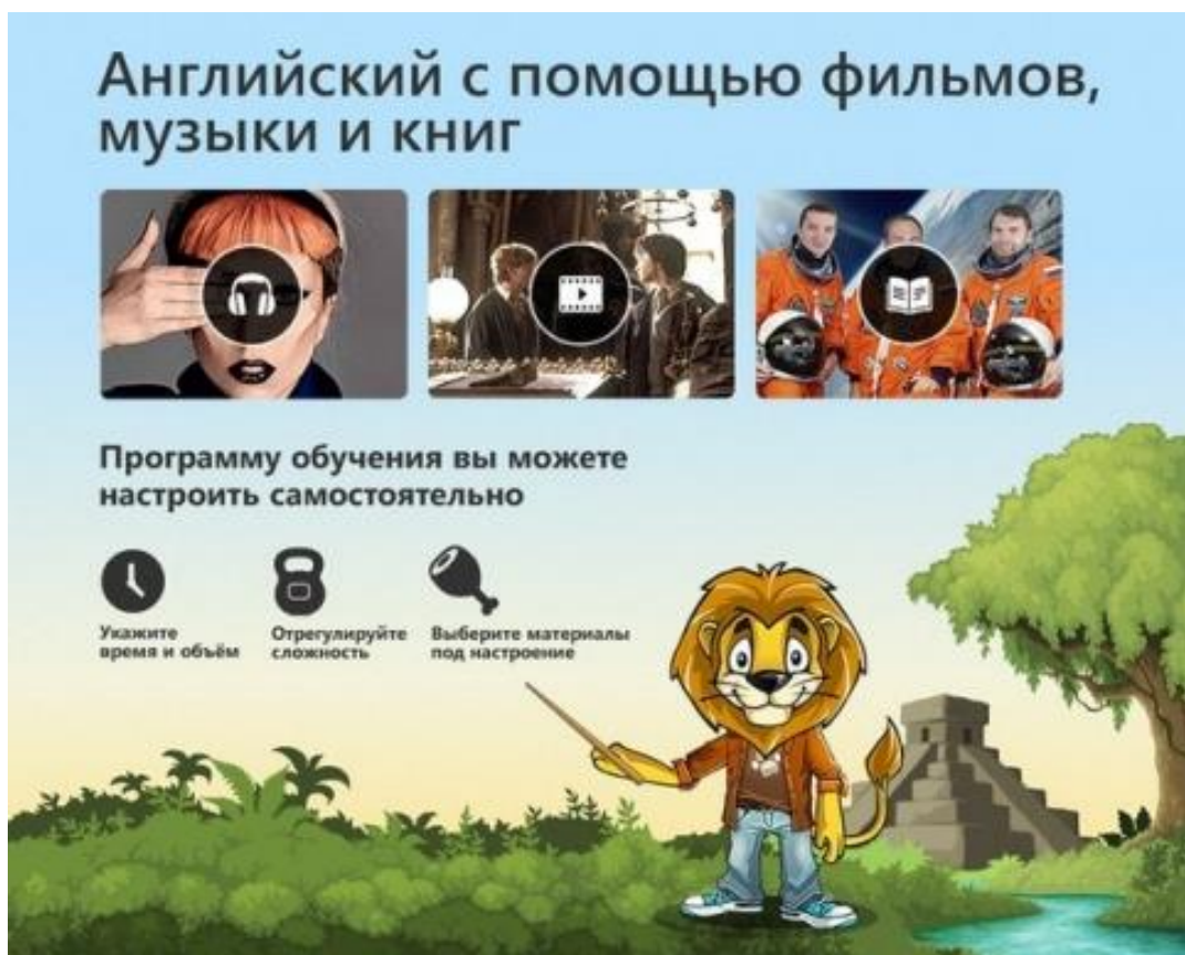
Панель функціональних можливостей проекту для вивчення та практики англійської мови LinguaLeo

2. Доступна функція спілкування з іншими користувачами, які теж вивчають і практикують англійську мову за допомогою проекту. Користувач може здійснити пошук по базі та обрати користувачів для спілкування. У вікні діалогу можна задати тему спілкування (спорт, кіно, погода, звичайний чат), а також використовувати онлайн-розмовник для розвитку комунікативної культури. Повідомлення можна перекладати, тобто спілкуючись з користувачем високого рівня володіння мови незнайомі слова та вирази можуть перекладатись за потреби системою та заноситись в індивідуальний словник для подальшого вивчення та засвоєння. Користувачі, з якими студент спілкується найбільше, можуть додаватись ним у спеціальну групу (так званій "прайд"). Користувачі, які знаходяться в одному "прайді", можуть спілкуватись між собою, ділитись досягненнями та новими нагородами, а також мотивуватись до більш інтенсивного вивчення мови завдяки конкуренції.