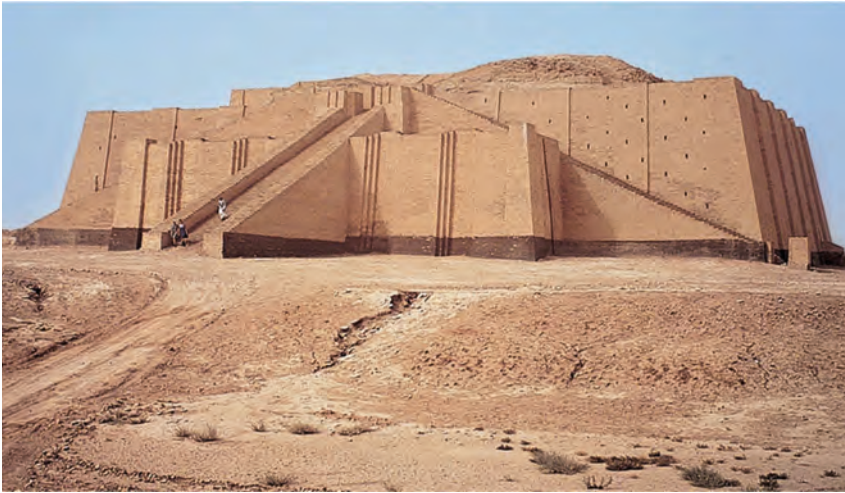
Зикурат в Урі

присвячений богу місяця Сіну. Сходи доходили до самої верхньої частини храму, сполучаючи поверхи між собою. Пізніше зикурат в Урі перебудували, збільшивши число ярусів до семи. Символічно Всесвіт складався із 7 ярусів, 7 ярусів зіккурату ототожнювалися з рівнями Всесвіту.