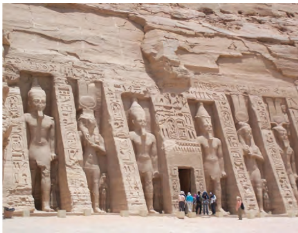
Малий храм Рамзеса II в Абу-Сімбелі

Ще одна справжня перлина давньоєгипетської архітектури – скельний храм фараона Рамзеса II в Абу-Сімбелі . Час правління Рамзеса Другого відноситься до пізнього періоду Нового царства. Рамзес правив 67 років. Він остаточно добудував Карнакський і Луксорський храми і спорудив на свою честь цілий комплекс Рамзесеум, куди входили палац і Великий храм, а також Малий храм, присвячений дружині Рамзеса Нефертарі. Храм побудований у скелі. Біля входу в храм чотири фігури зображають самого фараона і головних богів, кожна заввишки 21 м.