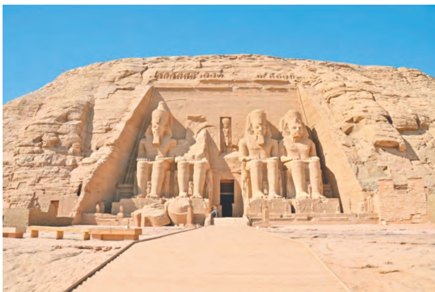
Статуї фараона Рамзеса II біля входу в храм в Абу-Сімбелі

Як Великий, так і Малий храми під час будівництва Асуанської греблі були перенесені в інше місце, щоб уникнути затоплення. Храм усередині не має штучного освітлення. Він орієнтований таким чином, що один раз на рік – у день приходу Рамзеса II на престол – сонячне проміння досягає головного святилища, освітлює обличчя статуй Рамзеса і Амона, а також вибитий на стіні текст мирної угоди з хеттами, пе ремогу над якими здобув фараон.