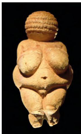
Жіноча статуетка з Віллендорфа

Одним з перших свідчень про увагу людей до самої себе можна вважати так званих палеолітичних венер . Так археологи назвали численні жіночі зображення у вигляді невеликих скульптурок з каменю, кісток або глини, які були знайдені під час розкопок. Майже всі вони позначені гіпертрофованими ознаками жінки-матері. При цьому кінцівки в них лише намічені. Спотворені форми цих статуеток спричинили їх іронічне найменування “венерами” (наприклад, так звана Венера Віллендорфська). Жіночі зображення особливо притаманні художній культурі доби матриархату, коли рід підтримувався жінкою, охоронницею дому та вогнища. Первісні “венери” уособлювали архаїчні уявлення про жінку-матір, продовжувачку