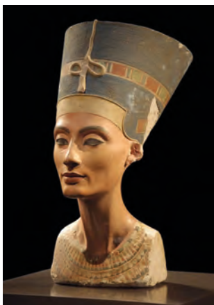
Портрет цариці Нефертіті

Великого розвитку набуло створення скульптурних портретів . За уявленнями єгиптян, портретні статуї відігравали роль двійників померлих і служили вмістищем їхніх душ. Давньоєгипетські статуї завжди строго пропорційні, фронтальні та статичні. Згідно з віруваннями одна з душ померлого – Ка – повинна була “поселитися” в його зображенні. Щоб Ка “впізнала” свою матеріальну оболонку, стали виготовляти посмертні гіпсові маски. Так зародилося портретне мистецтво Єгипту. Один з найзнаменитіших жіночих скульптурних образів у всьому світовому мистецтві – портрет Нефертіті, дружини фараона-реформатора Ехнатона. При розкопках Ахет-Атона була знайдена майстерня скульптора Тутмеса, а в ній – портрети членів царської родини. Зображення цариці Нефертіті у високому головному уборі зазвичай відтворюють у профіль, при цьому не видно, що робота над зображенням другого ока не закінчена. Одні дослідники пояснюють цю обставину раптово перерваною роботою (у майстерні всюди – сліди погрому), інші – наміром художника, який не захотів, щоб його твір замурували в гробницю (в іншому місці вмістище Ка не могло знаходитися).