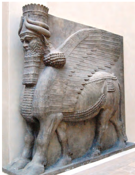
Бик Шеду із палацу Саргона II

Хоча столицею вважався Ашшур, але резиденцією царів IX – XIII ст. до н. е. найчастіше були Кальху, Ніневія або Дур-Шаррукін. Саргон II зробив столицею в 722 р. до н. е. Дур-Шаррукін (теперішній Хорсабад). Одночасно з будівництвом царського палацу було почато спорудження нового міста у вигляді майже правильного квадрата.