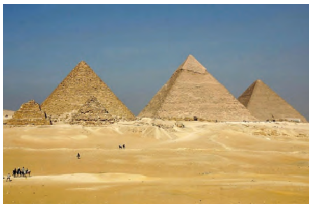
Піраміди в Гізі

Вчені-єгиптологи розробили безліч гіпотез про символічне призначення пірамід. Зокрема, перша гіпотеза була висловлена у XIX ст. єгиптологом Ернесто Скіапареллі. На його думку, піраміди символізували сонячну енергію, яка передавалася фараонові в його усипальницю. Чотири сторони були звернені до чотирьох сторін світу. Число “чотири” наділялося божественним смислом.