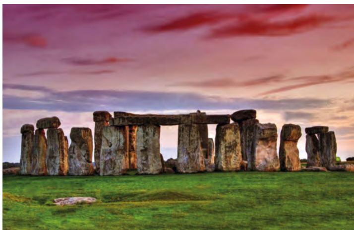
Мегалітичний культовий центр у Стоунхенджі

120 кам'яних брил вагою до 7 т кожна, висотою понад 4 м, а в діаметрі складає 30 м. Цікаво, що гори Преселлі в Південному Уельсі, звідки, як вважалося, доставляли будівельний матеріал для цієї споруди, знаходяться за 280 км від Стоунхенджа. Але сучасні геологи вважають, що кам'яні брили потрапили в околиці Стоунхенджа з льодовиків із різних місць. Дослідники висловлюють припущення про те, що Стоунхендж використовувався для спостережень за зорями, вираховування сонячних затемнень. Є ще версія, яку в науковому світі розцінюють як абсолютно неймовірну. Вважається, що Стоунхендж – це злітна смуга для інопланетних кораблів. Нібито в 14 км від Аддіс-Абеби були знайдені наскельні малюнки, датовані віком у 5 тисяч років, на яких був зображений малюнок побудови, дуже схожій на Стоунхендж, з центру якої злітає щось подібне до космічного корабля.