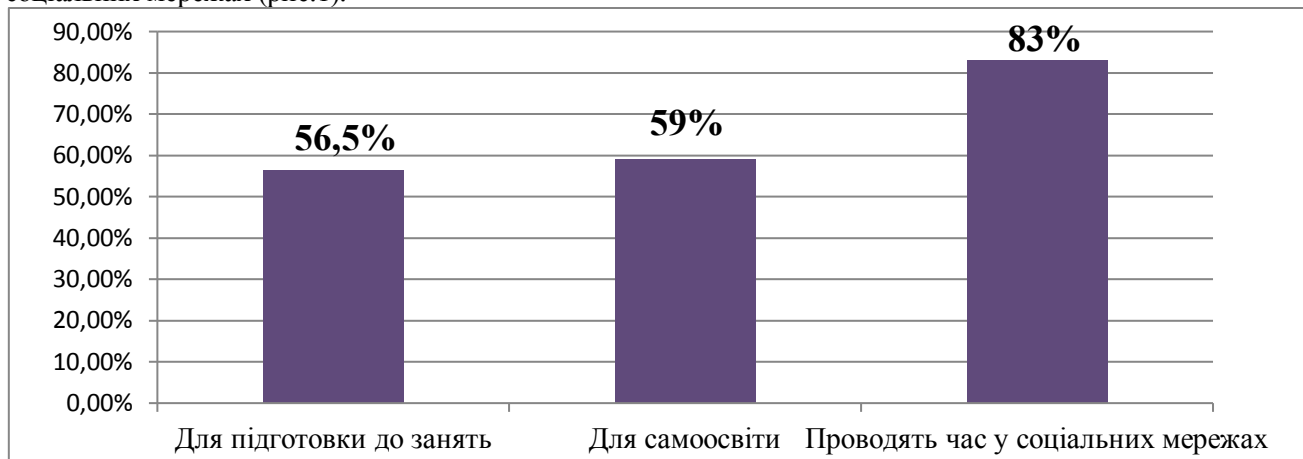
Рис.1. Графічне відображення відповідей на питання «Для чого Ви застосовуєте цифрові технології?»

На перше запитання більше 56 % опитаних відповіли, що застосовують цифрові технології для підготовки до занять. Близьким за кількістю виборів до цього виявився варіант «для самоосвіти» (59%). Майже всі студенти (83%) застосовують технології пошуку інформації та проводять вільний час у соціальних мережах (рис.1).