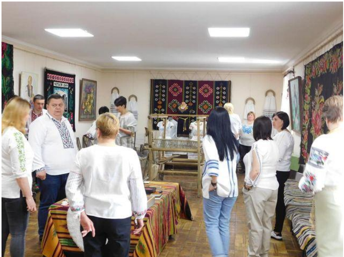
Рис. 12. Популяризації першоджерел Ямпільським музеєм образотворчого мистецтва