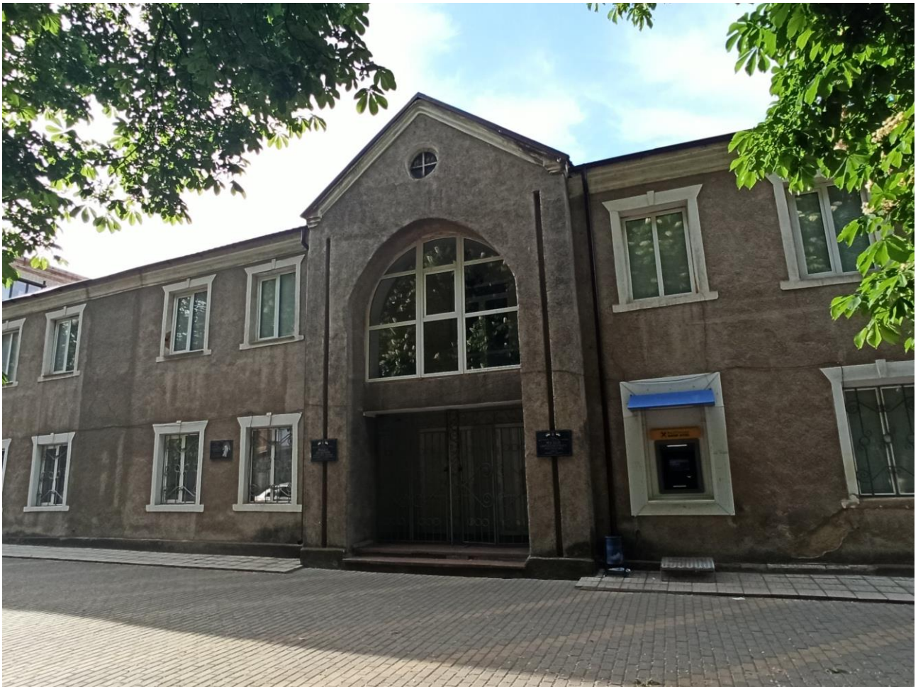
Рис. 1. Ямпільській музей образотворчого мистецтва Ямпільської міської ради

При музеї діє краєзнавчий відділ. Нещодавно в ньому був зроблений внутрішній капітальний ремонт і він очікує на художній проєкт, закупівлю вітрин та створення оновлених експозиційних виставкових залів (рис. 2). Є в планах перейменування його з краєзнавчого відділу на «Музей археології».