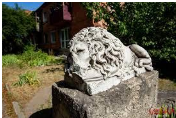
Рис. 3. Статуї – два леви – подаровані Папою Римським вірянам Ямполь

Значну роботу проводить створений при музеї в 2004 році народний аматорський колектив подільської вишивки «Солов'їні вічка» (рис. 4), який є неодноразовим учасником міських, районних, обласних, всеукраїнських і міжнародних фестивалів (рис. 5) і різного рівня виставок. Вишивальниці колективу проводять як в музеї, так і за його межами майстер-класи (рис. 6), круглі столи (рис. 7), персональні виставки, вдосконалюючи свої вміння та залучаючи всіх бажаючих пізнати секрети вишивання.