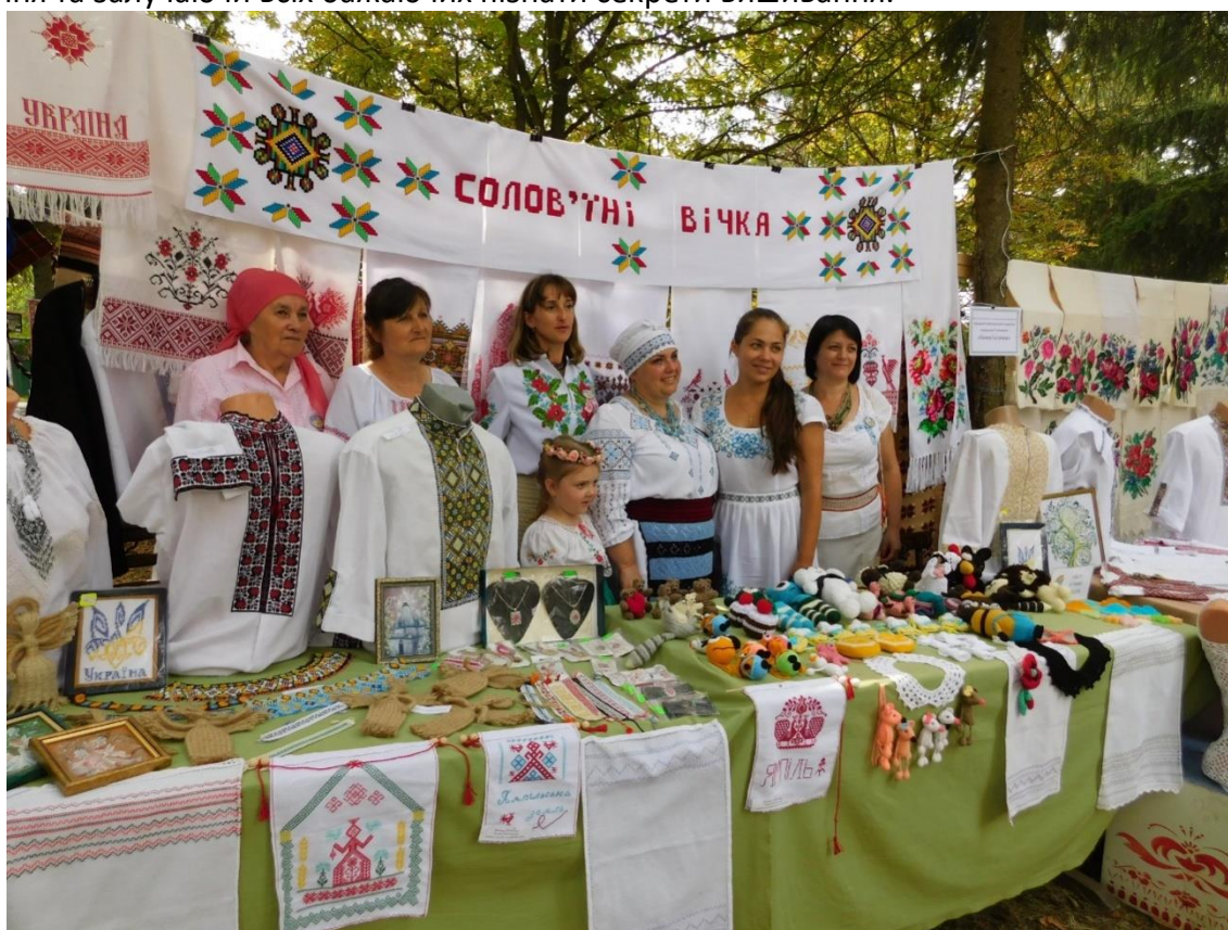
Рис. 4. Народний аматорський колектив подільської вишивки «Солов'їні вічка»

Значну роботу проводить створений при музеї в 2004 році народний аматорський колектив подільської вишивки «Солов'їні вічка» (рис. 4), який є неодноразовим учасником міських, районних, обласних, всеукраїнських і міжнародних фестивалів (рис. 5) і різного рівня виставок. Вишивальниці колективу проводять як в музеї, так і за його межами майстер-класи (рис. 6), круглі столи (рис. 7), персональні виставки, вдосконалюючи свої вміння та залучаючи всіх бажаючих пізнати секрети вишивання.