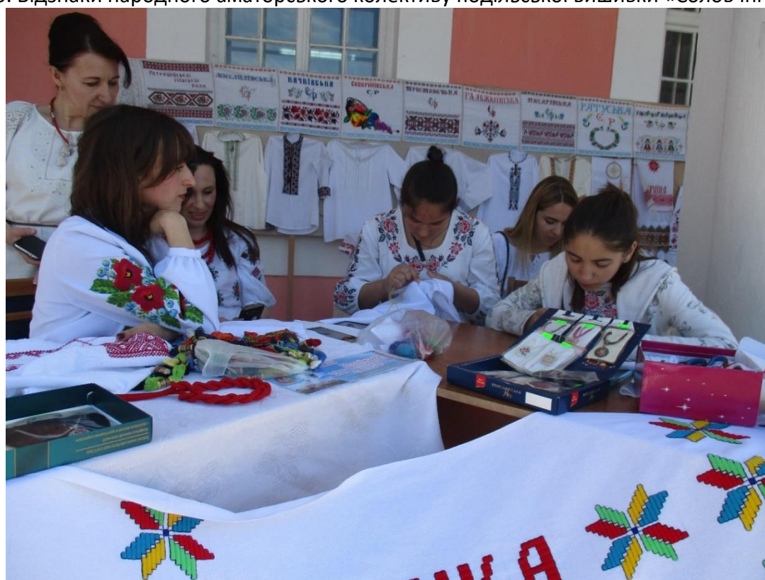
Рис. 6. Майстер-клас від вишивальниць народного аматорського колективу подільської вишивки «Солов'їні вічка»