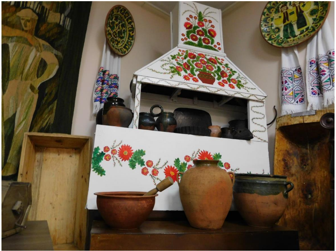
Рис. 9. Експонати краєзнавчого профілю Ямпільського музею образотворчого мистецтва