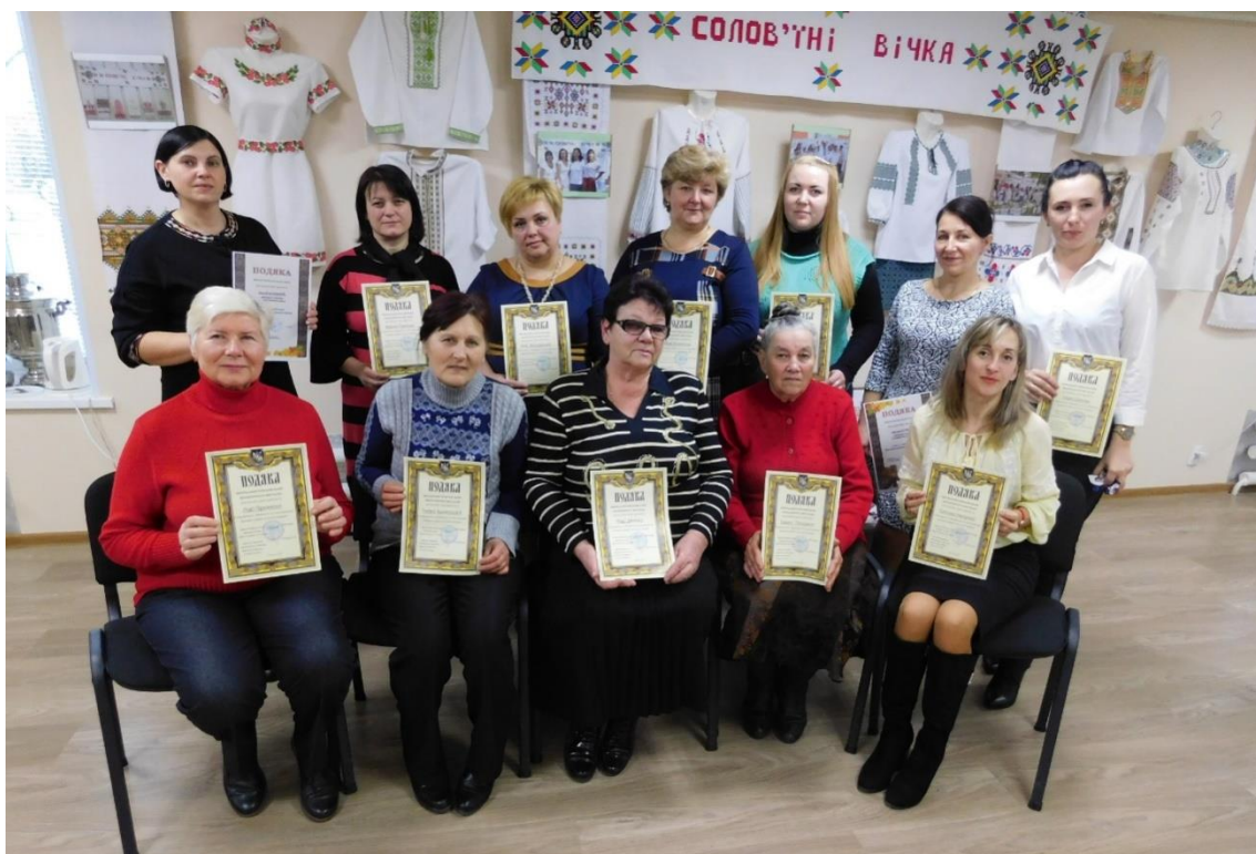
Рис. 5. Відзнаки народного аматорського колективу подільської вишивки «Солов'їні вічка»