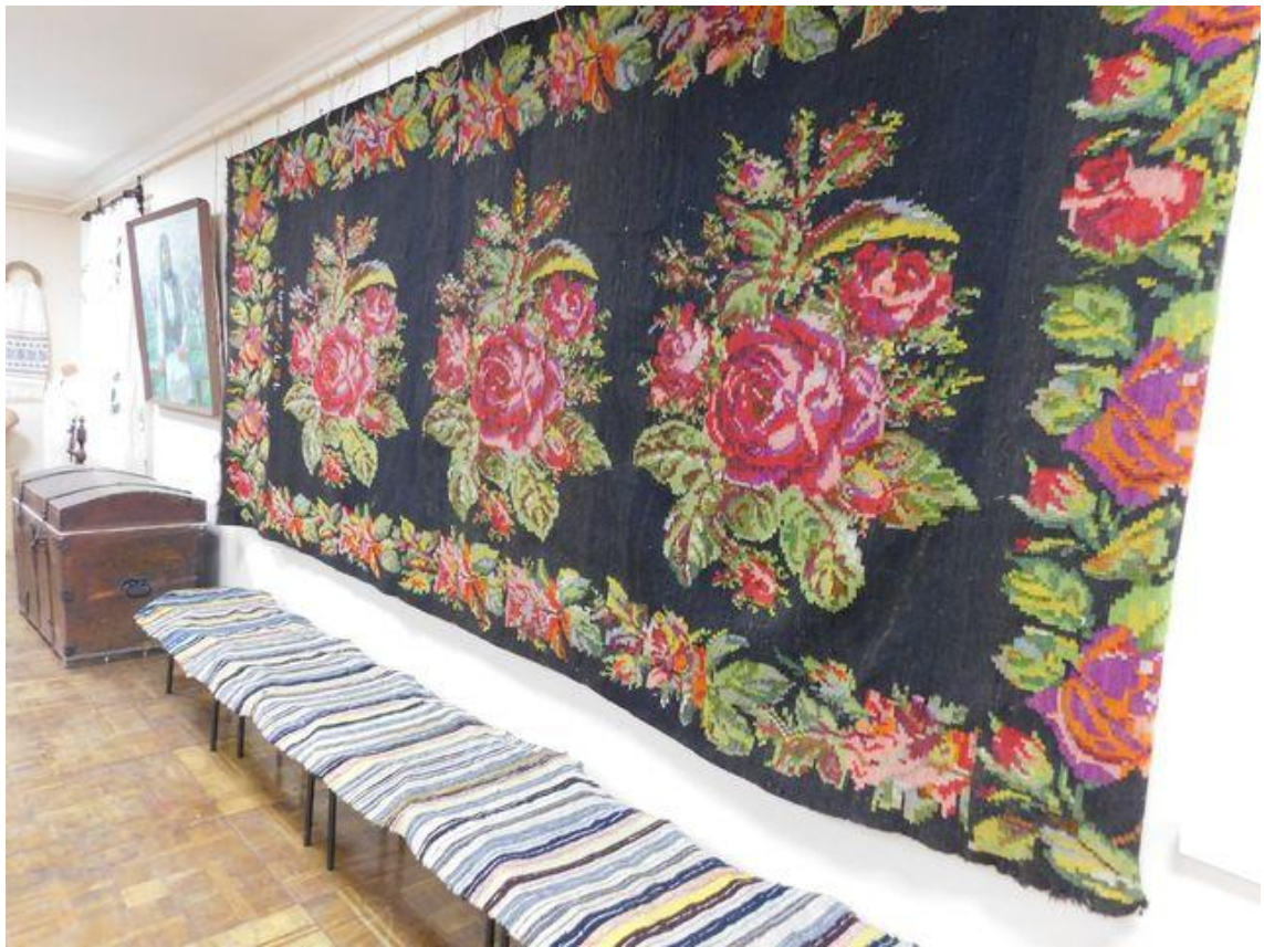
Рис. 11. Колекції Ямпільського музею образотворчого мистецтва