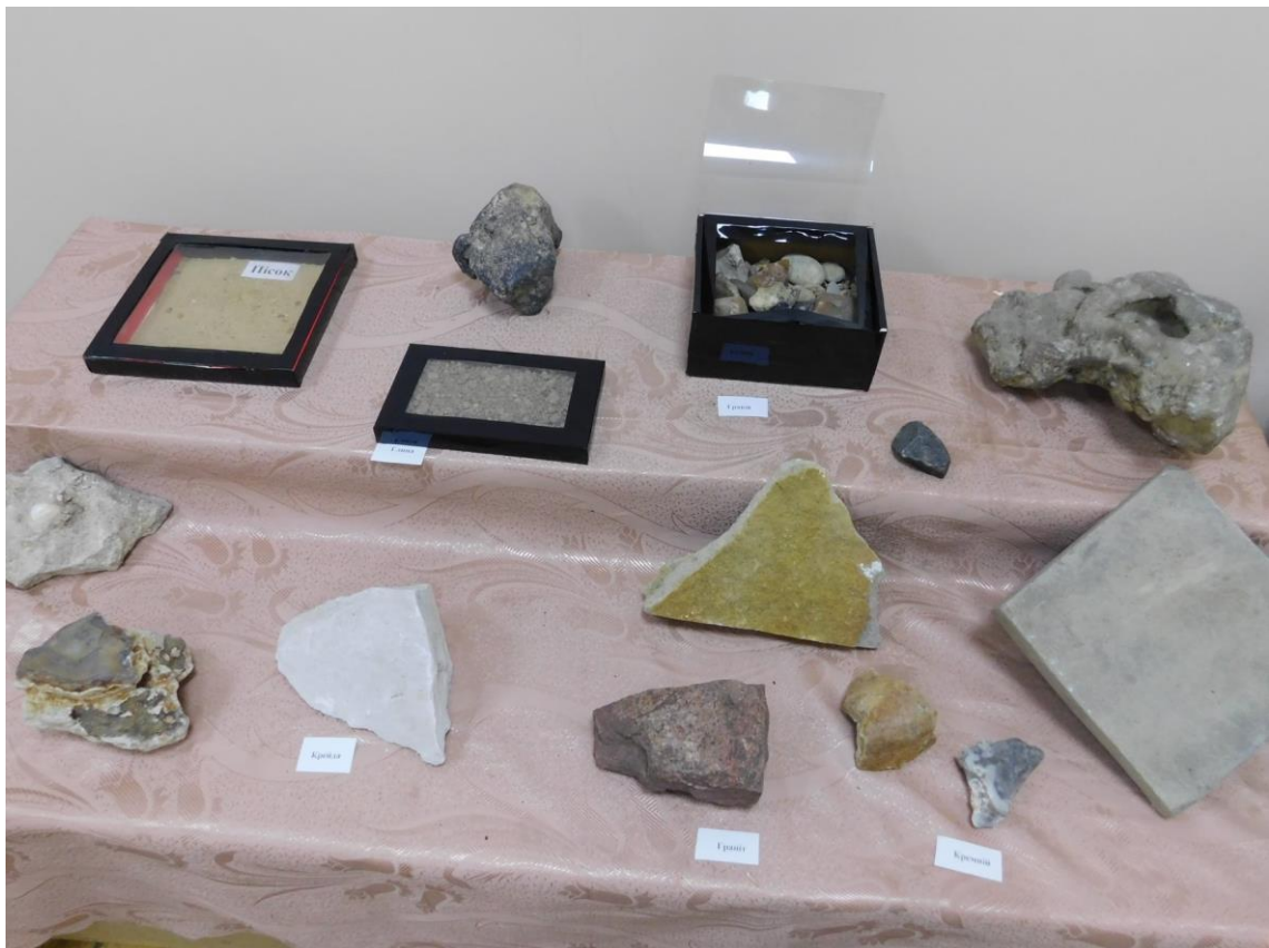
Рис. 10. Геологічні колекції Ямпільського музею образотворчого мистецтва

Друга особливість музеїв полягає в тому, що вони працюють з дуже різноманітними першоджерелами та використовують геологічні (рис. 10), валеологічні, зоологічні, антропологічні та інші природні колекції й пам'ятки матеріальної культури, знаряддя праці, інструменти, ремісничі вироби, зброю, побутові речі, пам'ятки духовної культури, твори живопису, графіки, скульптури, декоративне мистецтво, рукописні й друковані документи тощо (рис. 11).