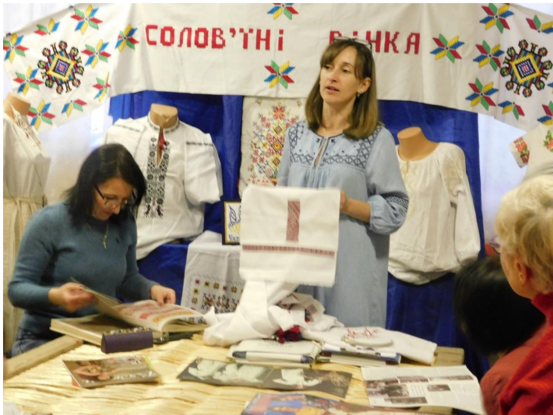
Рис. 7. Круглий стіл від вишивальниць народного аматорського колективу подільської вишивки «Солов'їні вічка»

Ямпільський музей має в своєму зібранні експонати як художнього (рис. 8), так і краєзнавчого профілю (рис. 9). Є одним із осередків краю, який об'єднує та підтримує народних майстрів, популяризує, зберігає і активно розвиває традиції народного мистецтва.