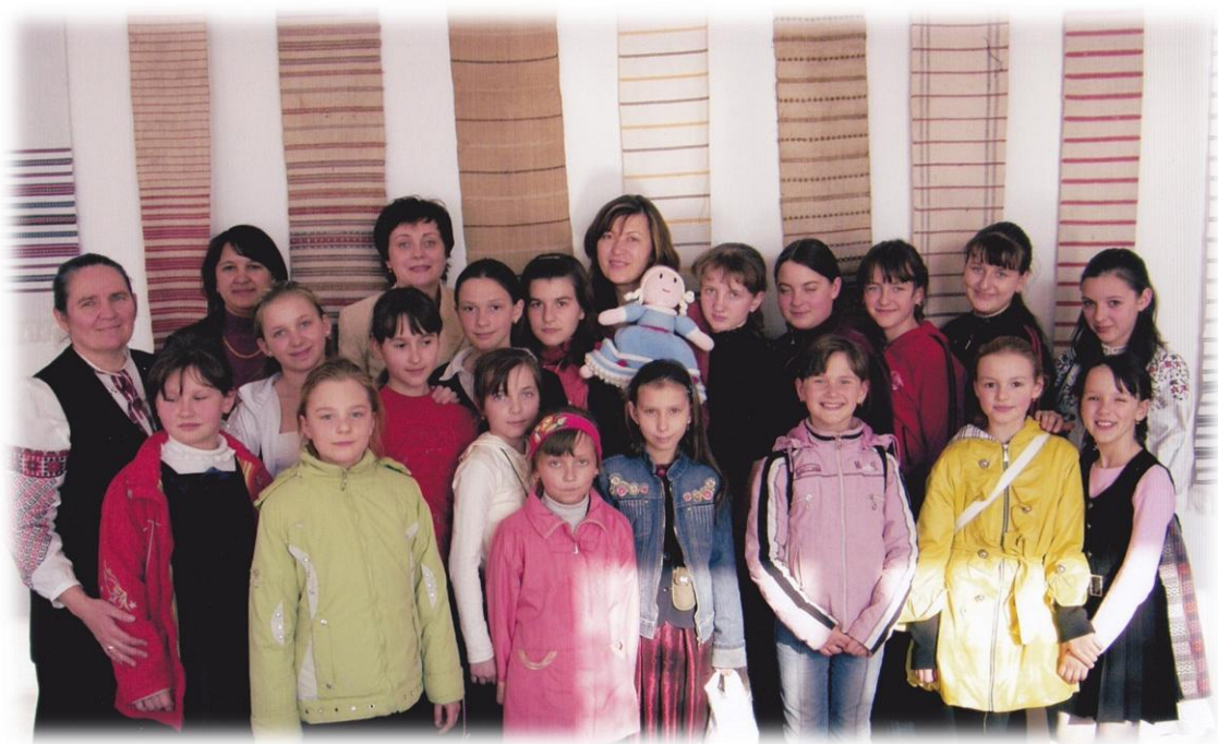
2009 р. Учні та вчителі НВК №2 м. Немирів у навчально-науковій лабораторії Вінницького державного педагогічного університету імені Михайла Коцюбинського