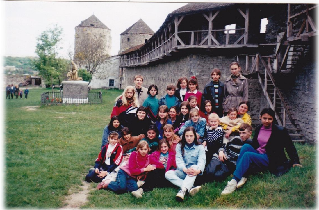
Згори донизу 2002 р., гімназистки на святі «Великодня писанка» у ВДПУ