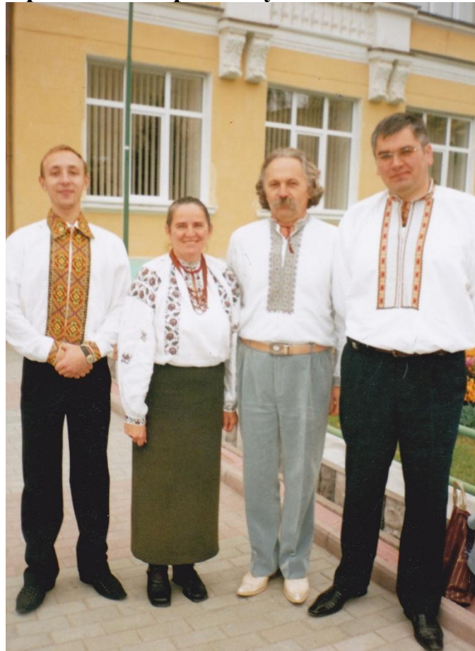
2006 р. Дні народознавства