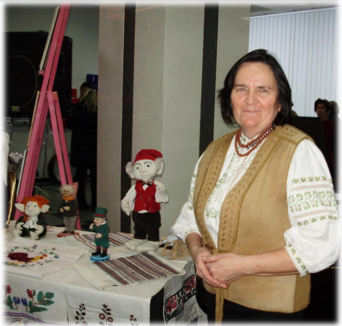
2017 р. Участь у міських заходах