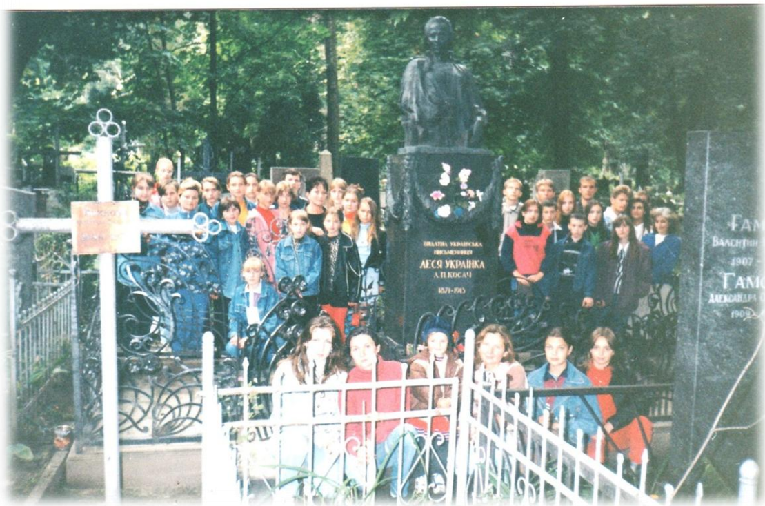
Згори донизу 1998 р., один день з життя гімназії