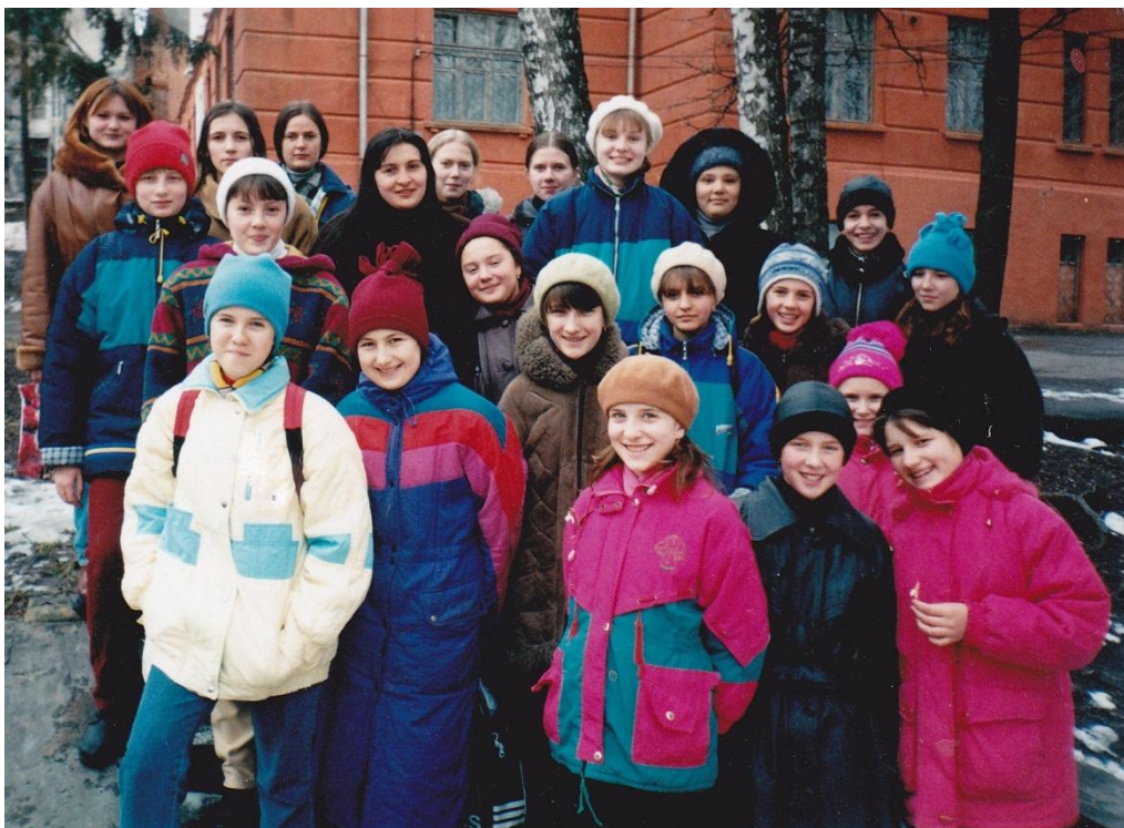
2001 р. Гімназистки та викладачі