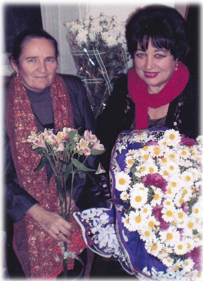
2011 р. Заслужений журналіст України Ганна Секрет