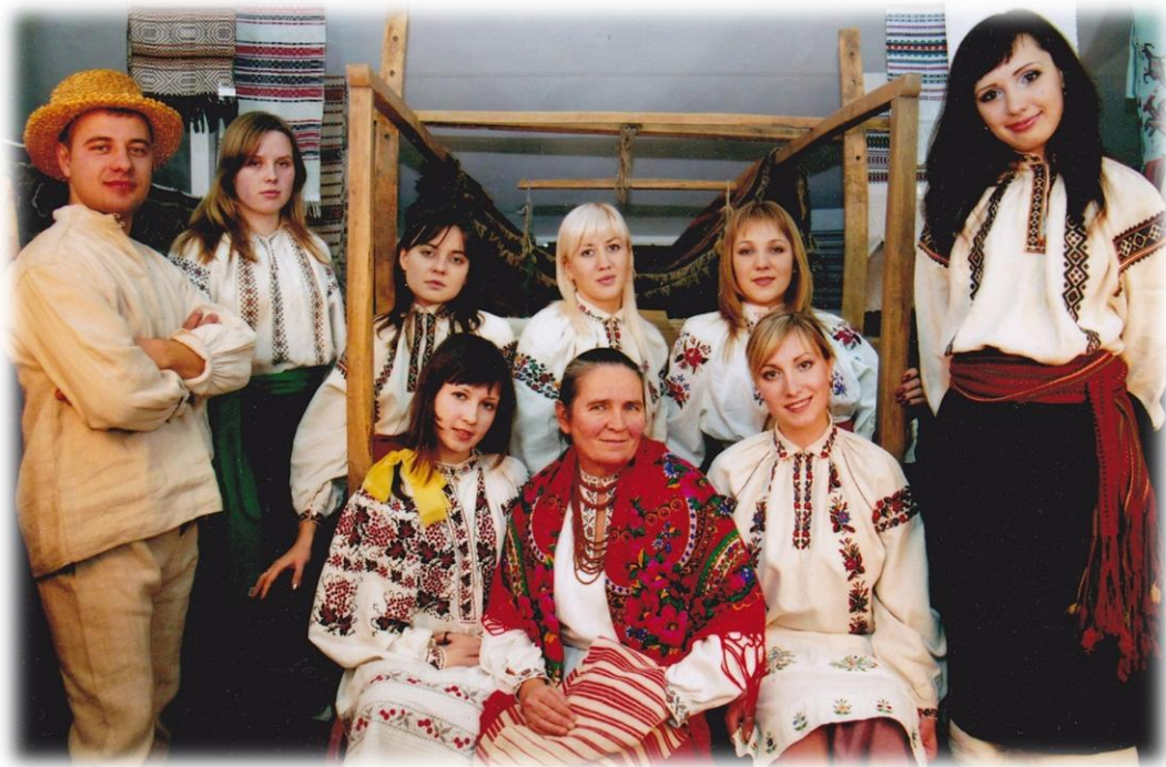
2007 р. У навчально-науковій лабораторії Вінницького державного педагогічного університету імені Михайла Коцюбинського