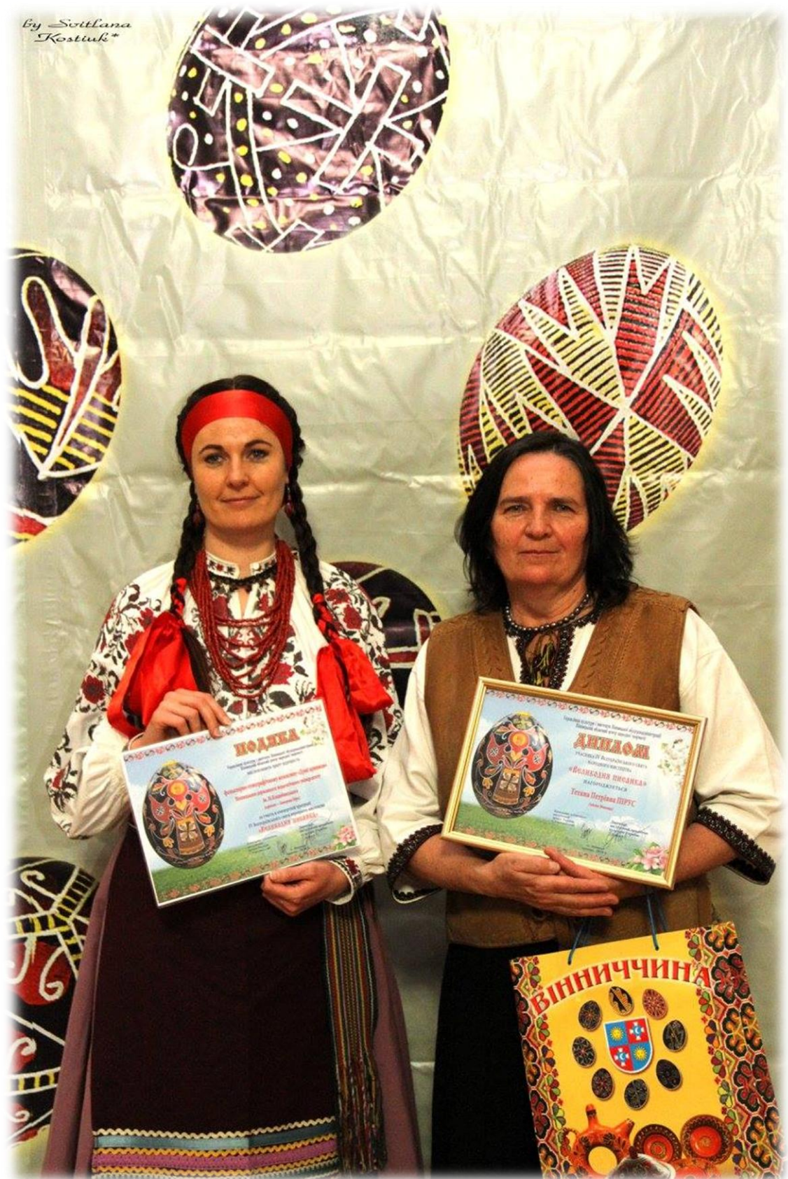
2016 р. м. Вінниця. Всеукраїнське свято народного мистецтва «Великодня писанка». Почесні нагороди