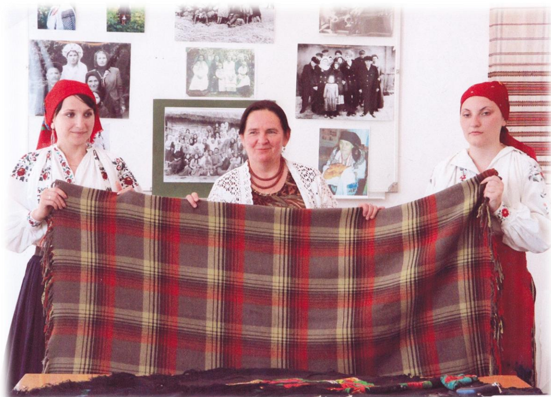
2012 р. Відкриття виставки «Хустино моя терновая»