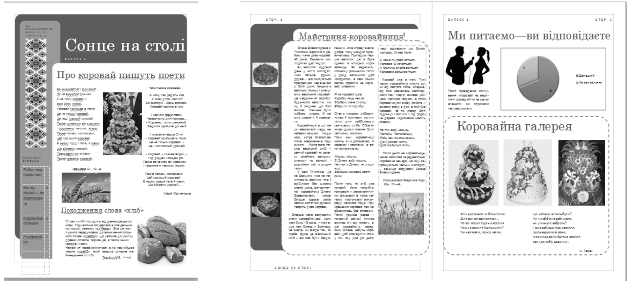
Рис. 2. Зразок газети, розробленої учасниками проекту

Кінцевим результатом роботи було створення та презентація учнями своїх напрацювань у вигляді публікацій: збірник рецептів «Бабусин коровай», календар «Коровай, коровай, кого хочеш вибирай», презентацій, веб-сайту «Благослови Боже, і отець, і мати...».