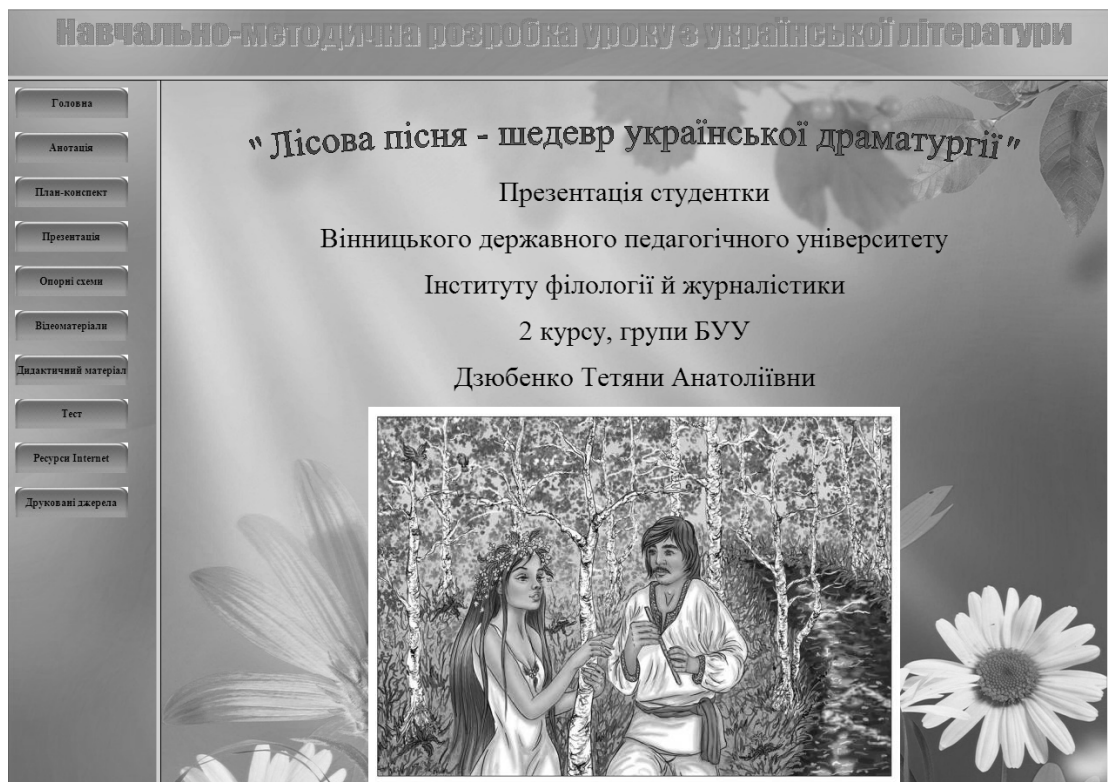
Рис. 1. Веб-сторінка розробки уроку

змодельовати за допомогою мультимедійної презентації через використання анімацій та гіперпосилань.