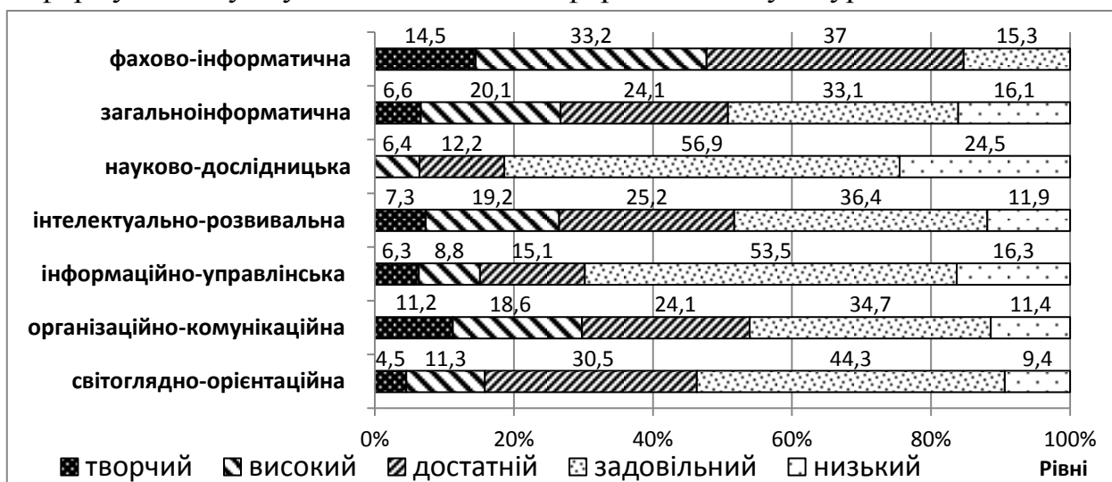
Рис. 2. Сформованість складових інформаційної культури майбутніх архітекторів на констатувальному етапі (за експертною оцінкою)

об'єктів», ні вивчення інших дисциплін професійного і практичного циклу не сприяють формуванню у студентів належної інформаційної культури.