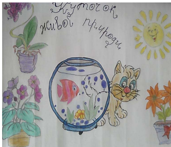
Рис. 2. Модель куточка живої природи Анни Г. (4 курс)