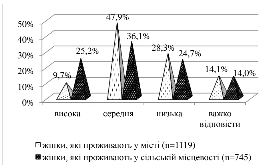
Рис. 3. Оцінка власної рухової активності впродовж доби дорослими жінками, які проживають у сільській і міській місцевості

Проте, рухова активність жінок, які проживають у селі, має переважно побутовий характер і лише незначна кількість жінок вказали, що їм властива спеціально організована рухова активність у вільний час. Натомість серед міських жінок відсоток тих, хто вказав на високий рівень рухової активності, значно менший, порівняно з жінками, які проживають у селі (9,7%).