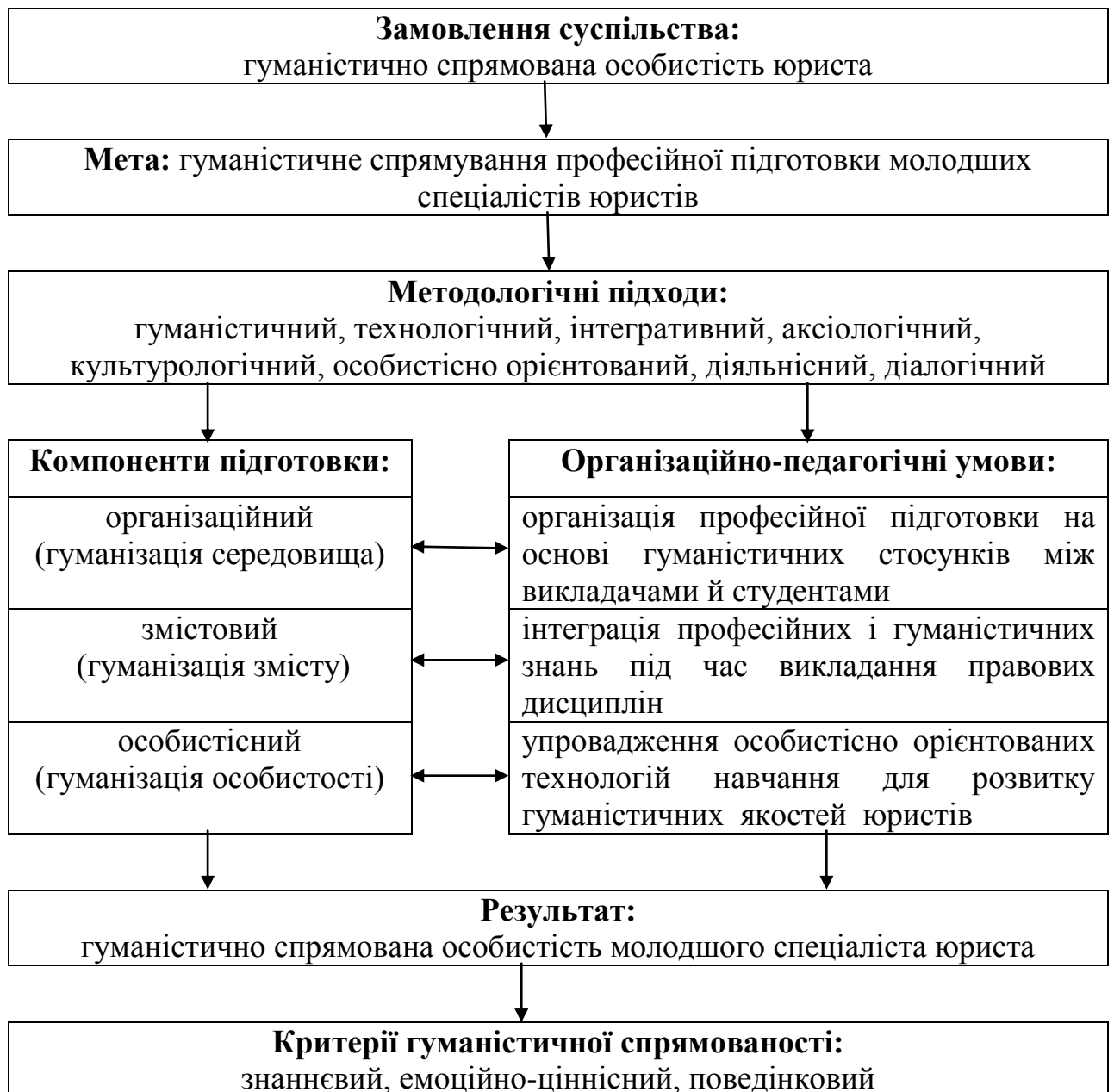
Рис. 1. Модель гуманістично спрямованої професійної підготовки майбутніх молодших спеціалістів юристів

професійної етики юриста. Після ознайомлення з відповідними посібниками проводились дискусії та круглі столи на теми: „Етичний кодекс юриста”, „Моральна відповідальність юриста” та ін.