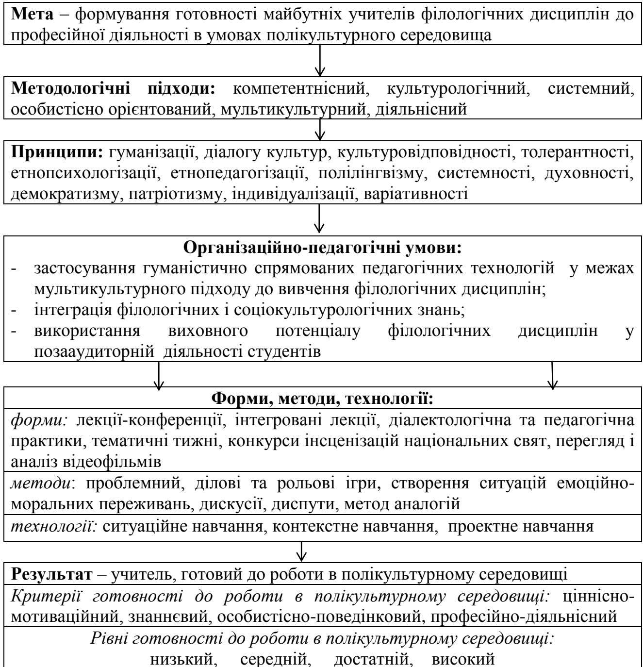
Рис. 1 Модель підготовки майбутніх учителів філологічних дисциплін до професійної діяльності в умовах полікультурного середовища

любити рідну мову та культуру і толерантно ставитись до представників інших етносів.