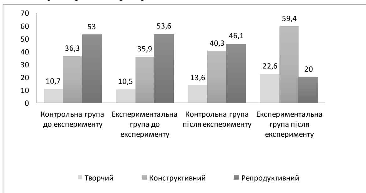
Рис. 2. Результати дослідно-експериментальної роботи перевірки ефективності педагогічних умов самореалізації студентів ЗВО у дозвілєвій діяльності

Для розрахунків вірогідності різниці даних у різних групах ми використовували t-критерій Стюдента, який розраховували за стандартною функцією програми Excel. Щоб довести, що обрані групи не мають статистично значущих відмінностей на початку експерименту, ми скористалися методикою розрахунку непараметричного критерію згоди Пірсона \chi^2 . Щоб установити не випадковість змін, які відбувались у досліджуваних групах після експерименту, ми скористалися параметричним критерієм Стюдента Z_{ст} .