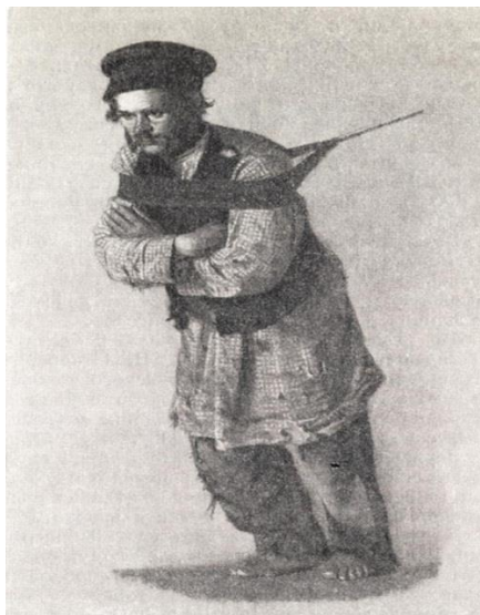
Рис. 3. Верещагін В. Бурлак у фуражці. 1866 р.

Ще одним цікавим елементом гардеробу, який згадується у переліку одягу для хлопчиків, був літній халат – предмет напівдомашнього образу із пестряді – дешевої тканини, яка виготовлялася із залишків прядива різної якості (льон, шерсть) та різного кольору, що мала злегка шерстку поверхню. Колір зазвичай був строкатий, інколи в дрібну клітинку.