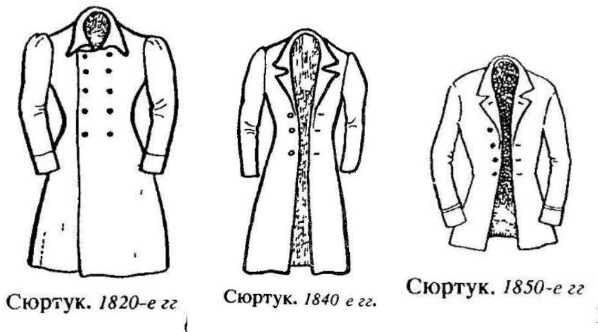
Рис. 1. Сюртуки. XIX століття

повстяноподібний застил, що закриває переплетення ниток [Словник української мови, 1978: 831].