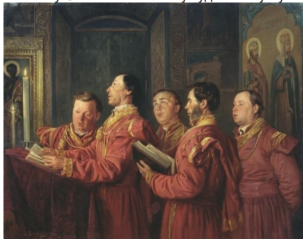
Рис. 6. Маковський В. Є. Півчі на кліросі 1870 р.

Відомий російський художник XIX століття, член Петербурзької Академії художніх мистецтв Володимир Єгорович Маковський у своїй картині «Півчі на кліросі» (рис. 6) [Маковський, 1870] зобразив хористів в урочистому вбранні під час богослужіння. На цій картині зображено п'ятьох дорослих чоловіків одягнених у яскраві червоні кунтуші, прикрашені позолоченими стрічками вздовж коміра, на рукавах та на плечах, а також із золотистими китицями. Картина зберігається у Севастопольському художньому музеї ім. М. П. Крошицького.