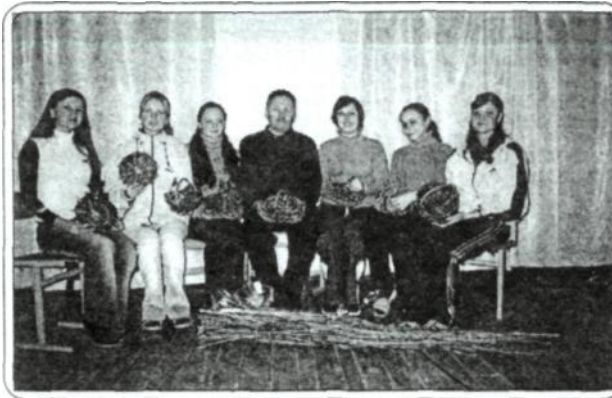
Рис. 13. Учасники етнографічного гуртка із виготовленими власноруч кошиками, 2004 р.