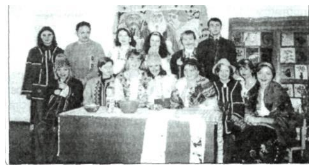
Рис 4. Практичне заняття «Розплітання коси», 2003р.