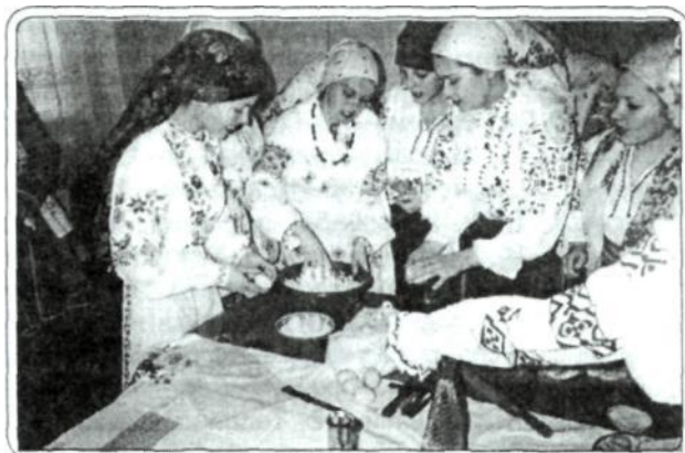
Рис 2. Практичне заняття «Випікання короваю», 2002р.