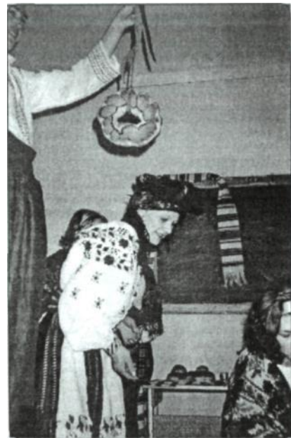
Рис 10. Андріївські вечорниці, 2004 р.