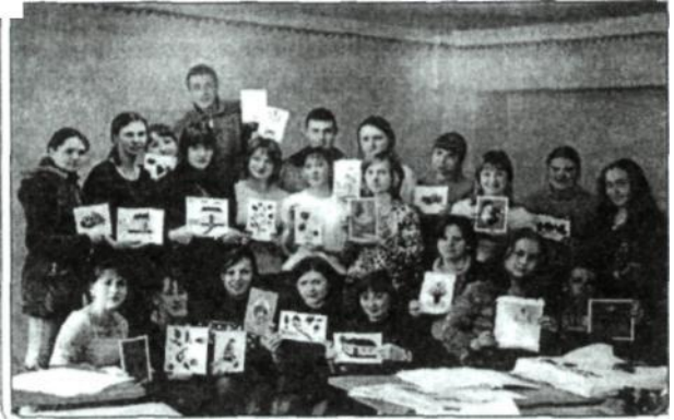
Рис 12. Студенти із власноруч виготовленими малюнками на склі