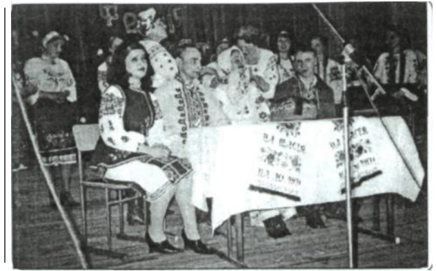
Рис 6. Покривання молодої. Фрагмент весільного обряду, записаний Н. Черняк у с Слободище Іллінецького району, 2003 р.