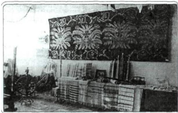
Рис 15. Фрагмент виставки «Ткацтво на Поділлі», 2000 р.