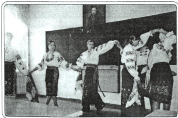
Рис 9. Веснянка «Вийтеся, огірочки», 2004 р.