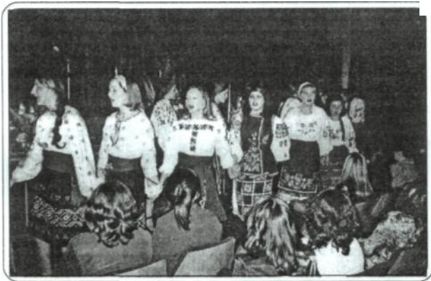
Рис 8. Фрагмент веснянки «Кривий танець», 2003 р.