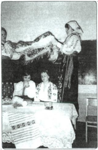
Рис 5. Покривання молодої. Фрагмент звіту по етнографічній практиці, 2004 р.