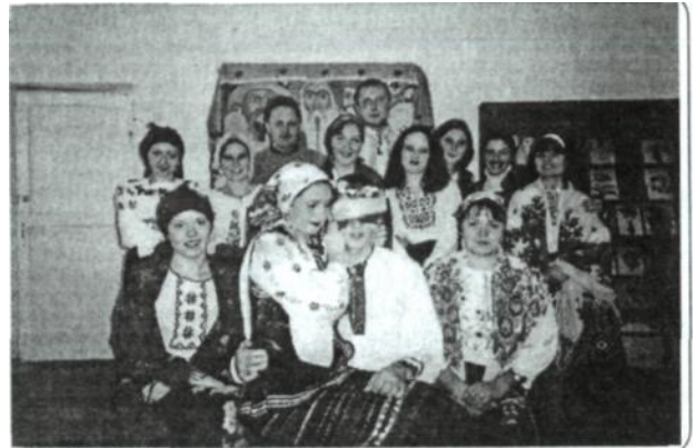
Рис 7. Практичне заняття «Покривання молодої», 2004 р.