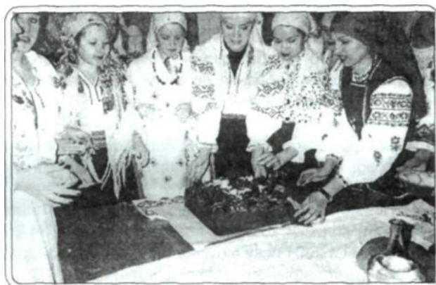
Рис 3. Практичне заняття «Випікання короваю», 2002р.