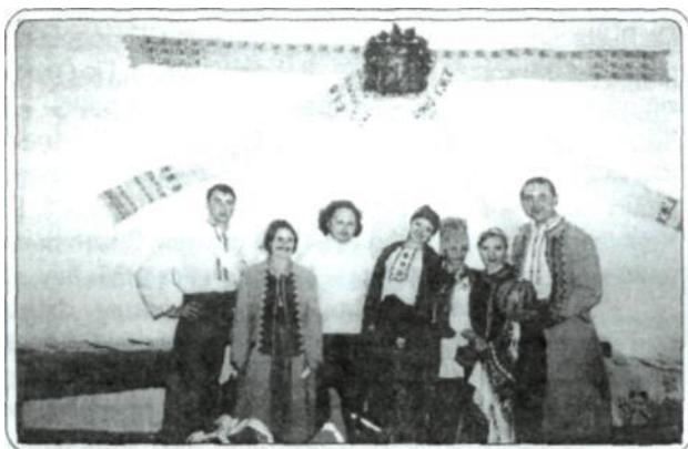
Рис 1. Студенти ІІІ-У-УА - учасники обряду «Невдале сватання», 2003 р.