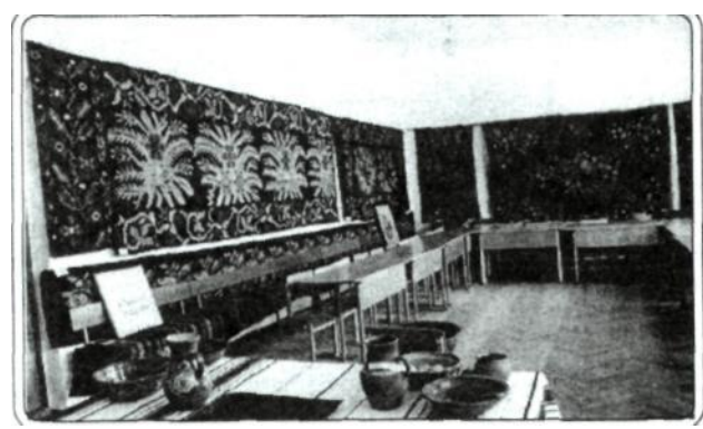
Рис 18. Фрагмент виставки «Килими Поділля», 2002 р.