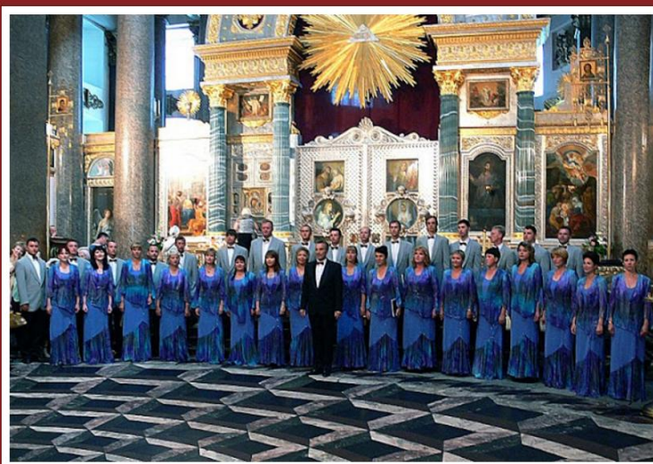
Академічний камерний хор «Вінниця»