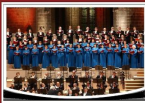
Національна заслужена капела України "ДУМКА"