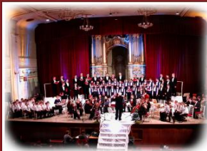
Львівська державна академічна чоловіча хорова капела "Дударик"