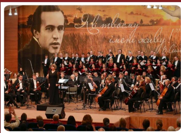
Заслужений академічний симфонічний оркестр та Академічний хор імені П. Майбороди Національної радіокомпанії України