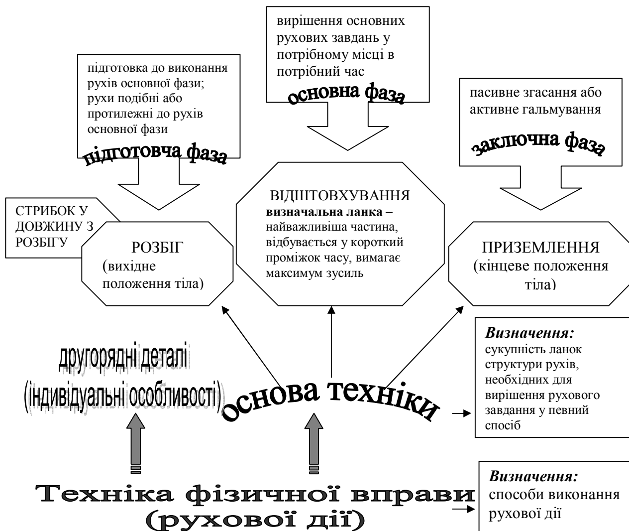
Рис 2. Опорний конспект №2 до теми «Засоби фізичного виховання дітей дошкільного віку».

вимоги до проектування та проведення занять фізичною культурою»; «Взаємозв'язок естетичного та фізичного виховання в педагогічній спадщині В.Сухомлинського»; «Мистецтво техніки фізичних вправ»; «Краса фізичної зовнішності людини»; «Естетизація освітнього середовища у процесі фізичного виховання дітей дошкільного віку (молодших школярів)»; «Використання педагогами нетрадиційних сюжетно-рольових занять фізичною культурою»; «Фізкультура, казка, гра» (з досвіду викладання фізичної культури в ДНЗ, у початковій школі); «Використання естетико-виховних методів, прийомів та форм роботи у процесі фізичного виховання дітей»; «Організація та методика проведення рухливих ігор на мистецькому матеріалі»; «Естетичний розвиток особистості дитини в процесі фізичного виховання», «Роль та значення естетики поведінки у фізкультурній діяльності» тощо.