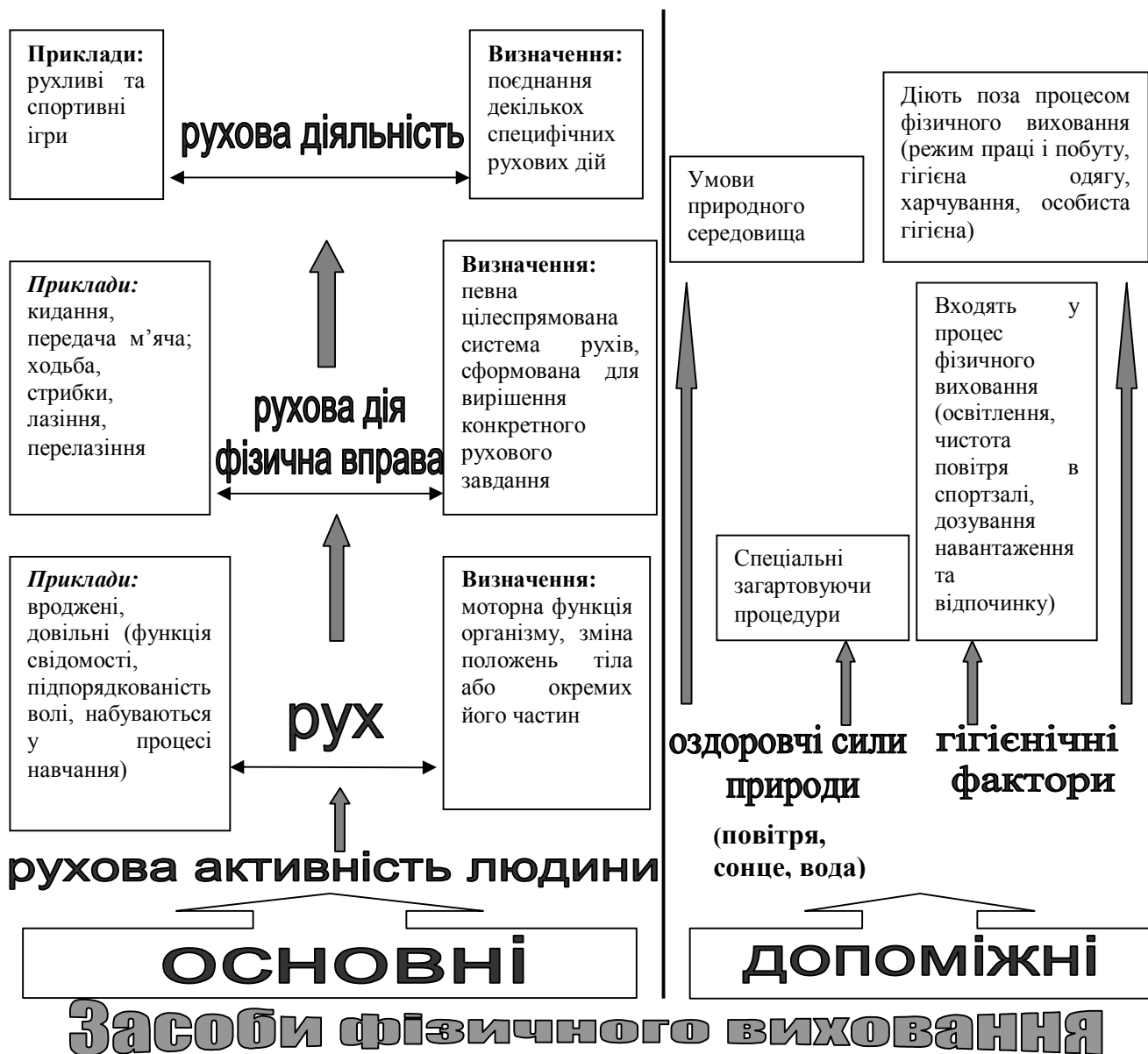
Рис 1. Опорний конспект №1 до теми «Засоби фізичного виховання дітей