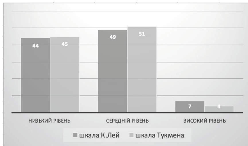
Рис. 1. Розподіл студентів за рівнем прокрастинації (у відсотках).

Далі нами були встановлені рівні прокрастинації за шкалою загальної прокрастинації К. Лей та шкалою прокрастинації Такмена. В результаті дослідження загального рівня прокрастинації було виявлено, що у студентів переважає середній рівень загальної прокрастинації. Аналіз результатів представлений на рис. 1.